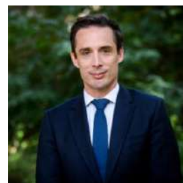
Jean-Baptiste Djebbari, ministre délégué chargé des Transports

C’est une ambition qui ne doit pas nous quitter. C’est la boussole qui va nous guider. »